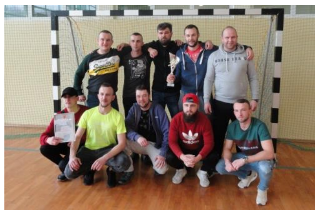
Zwycięska drużyna z miejscowości Dwikozy